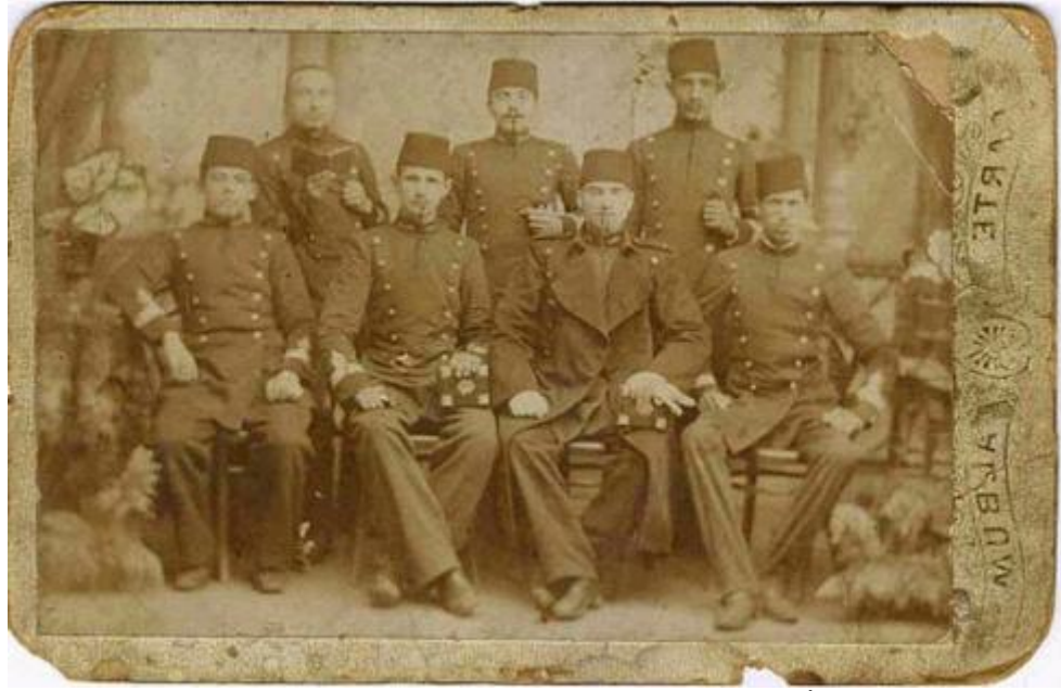
Harbiyeli Mustafa Kemal okul arkadaşları ile birlikte 1900, 1901-İstanbul

En fazla meşgul oldukları şeylerden biri de zamanın felsefesi ve fikrî cereyanları idi. Toplumun henüz halledilmemiş davalarıyla dimağlarını meşgul ederlerdi.”