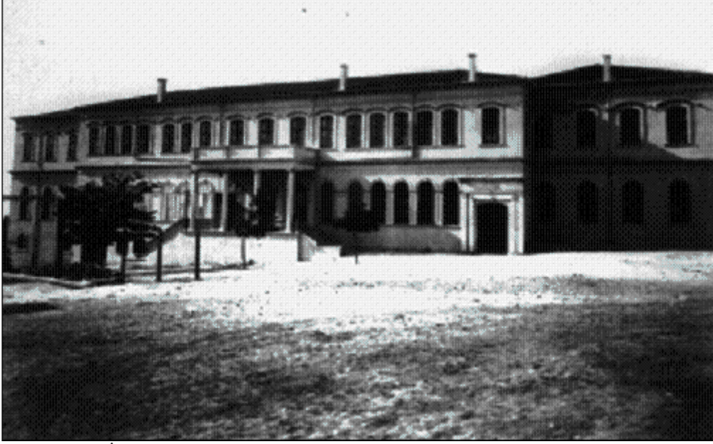
Harp Okulu - İstanbul