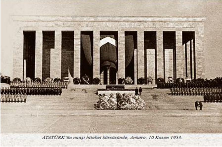
ATATÜRK'ün naağı hitabet kürsüsünde, Ankara, 10 Kasım 1953.