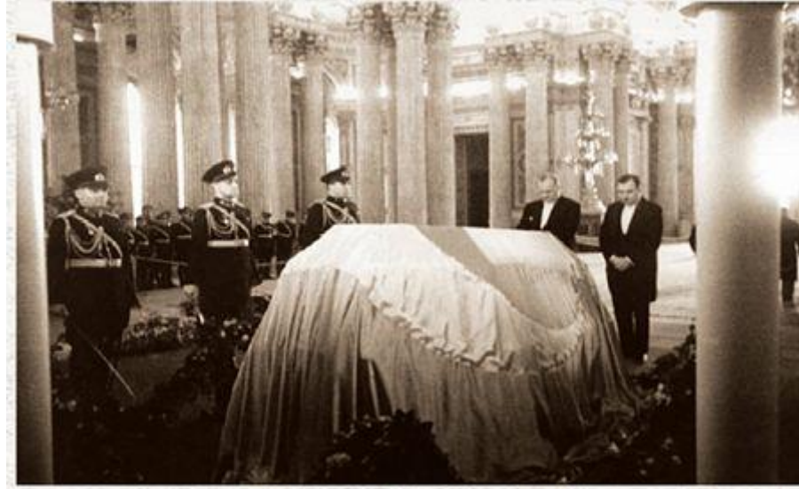
Dolmabahçe Sarayı, İstanbul, 16 Kasım 1938.