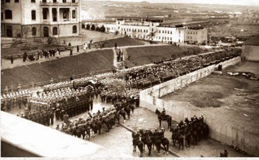
Ankara, 21 Kasım 1938.

yerlerden getirilen toprakların numuneleri birer vazo içerisinde, ATATÜRK'ün mezarının etrafını süslemektedir.